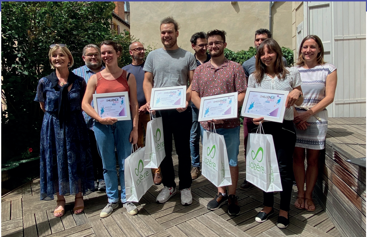
Promotion 2022 du Challenge Jeunes