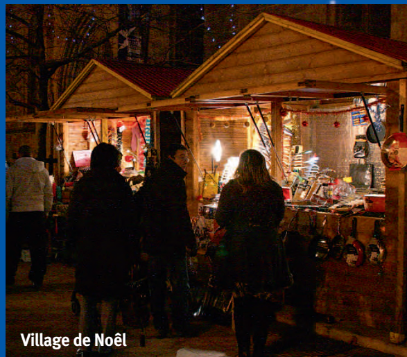
Village de Noël