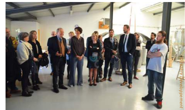
Inauguration de la Brasserie de la Naine en avril