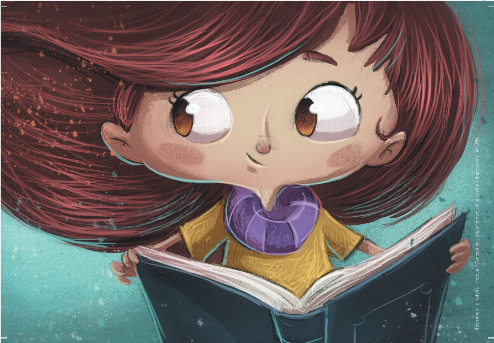
Illustration : cirodella - Fotolia / Conception : Département de la Lozère / Impression : AFLPH