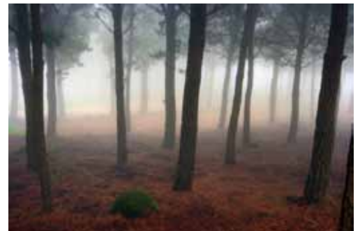
Forêt dans la brume, par Annabelle Chabert