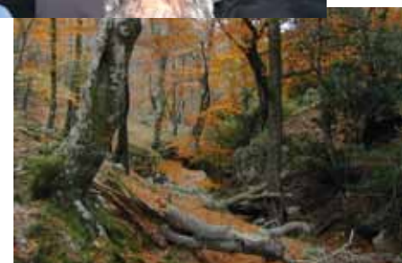
Une des plus vieilles hêtraie d'Europe : la Massane (Pyrénées-Orientales)