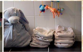
Mon stock de couches lavables est prêt à l'emploi !