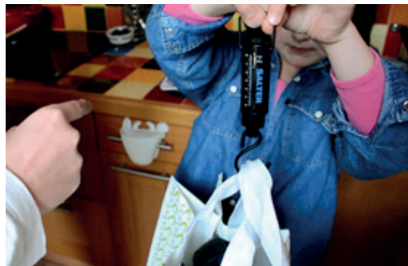
Le peson est entré dans les maisons : il est très utile pour prendre conscience de sa production de déchets, et quantifier les effets des nouveaux gestes.

Le 5 juin, les Éco-familles découvrent les résultats présentés par les accompagnateurs de l'opération, et échangent sur leurs bonnes pratiques.