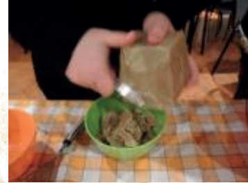
Les produits ménagers « maison » se fabriquent à partir de copeaux de savon de Marseille

« J'ai peu de temps disponible pour faire moi-même les produits ménagers. » « Cela reste très ciblé sur certains produits. » « On m'a parlé de boules de lavage qui servent de petites mains, je vais tester. » « Je fais essentiellement la lessive. Pour le liquide vaisselle, je le prends en vrac au magasin bio. » « Je trouve ce geste facile, je l'ai vite adopté ! »