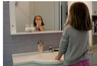
Une lingette en éponge pour me débarbouiller : c'est aussi simple que cela !

14 Éco-familles ont testé ce nouveau parcours de consommateur : ils partent avec leur cabas faire leurs courses, réemploient les bocaux, réutilisent des boîtes de toute sorte. Ils privilégient les couches lavables, les lingettes démaquillantes lavables, ou les rasoirs ou piles rechargeables. Ce geste est déclaré « facile », par 62% d'entre eux.