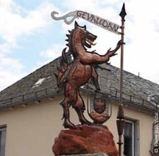
Statue représentant la Bête, à Aumont-Aubrac